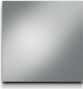
Vorderseite: Spiegel Front: Mirror