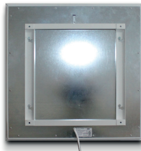
Rückseite mit Halterung Rear Plate with bracket