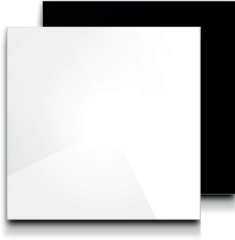
Vorderseite Glas: Weiß oder Schwarz Front Glass: White or Black